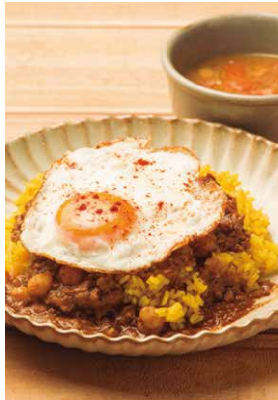
カレーピラフカレー (スープ) 800 Curry Pilaf Curry (w/ SOUP)