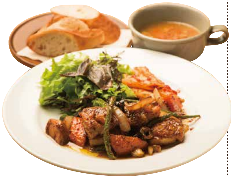
日替わりプレートランチ (スープ・パンorライス) 800 Today's Plate Lunch (w/ SOUP & BREAD or RICE)