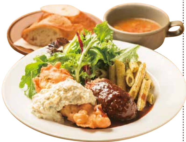
フリットランチ (スープ・パンorライス) 900 Fried Lunch (w/ SOUP & BREAD or RICE)