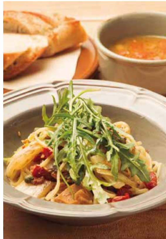
本日のパスタ (スープ・パン) 880 Today's Pasta (w/ SOUP & BREAD)

LUNCH: 11:00-14:00 I.o. ALL DAY : 11:00-22:30 I.o.(Mon-Fri)/ -21:00 I.o.(Sat, Sun, Holidays)