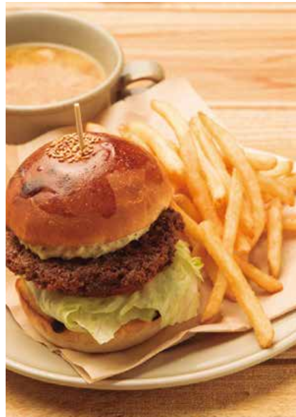
ハンバーガー (スープ) 950 Hamburger (w/ SOUP)