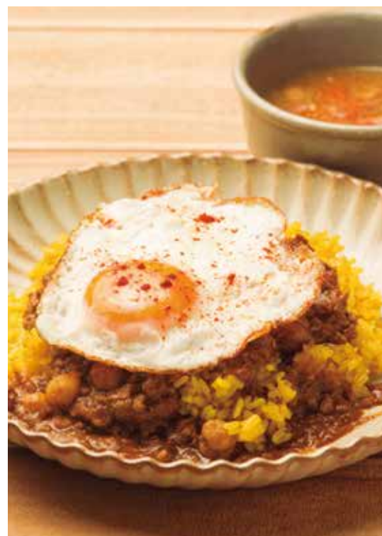
カレーピラフカレー (スープ) 800 Curry Pilaf Curry (w/ SOUP)