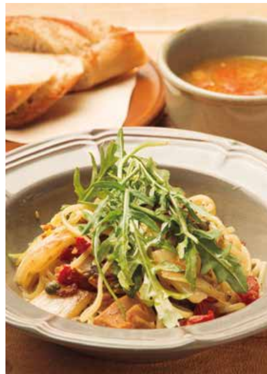
本日のパスタ (スープ・パン) 880 Today's Pasta (w/ SOUP & BREAD)

11:00-22:30 I.o.(Mon.-Fri)/ -21:00 I.o.(Sat, Sun, Holidays)