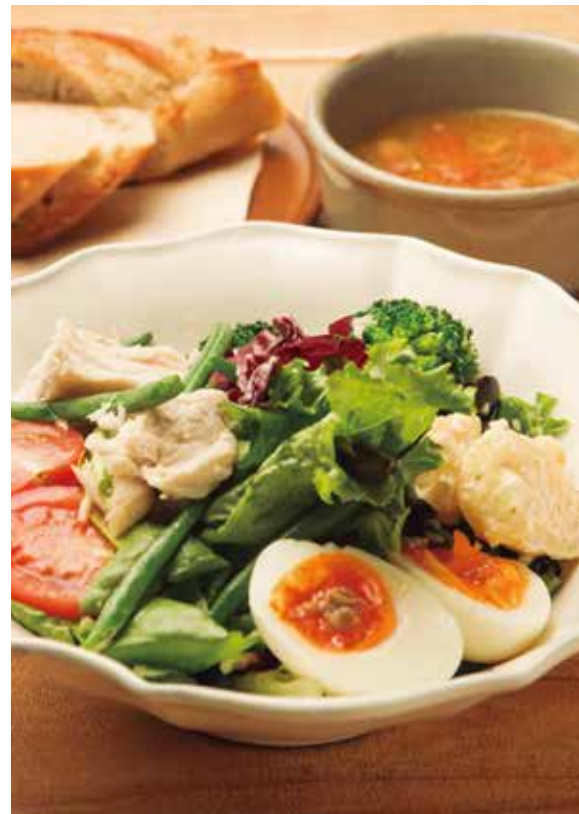
サラダニソワーズ (スープ・パン) 850 Salade Niçoise (w/ SOUP & BREAD)