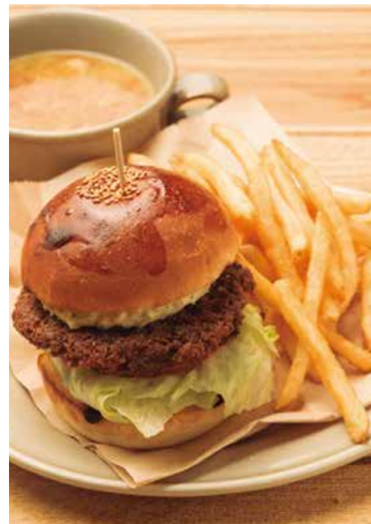
ハンバーガー (スープ) 950 Hamburger (w/ SOUP)