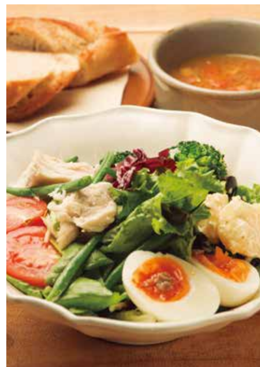
サラダニソワーズ (スープ・パン) 850 Salade Niçoise (w/ SOUP & BREAD)