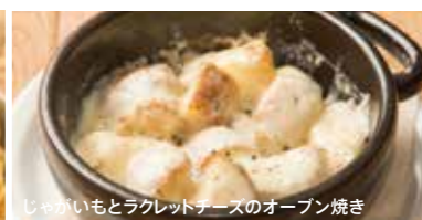
じゃがいもとラクレットチーズのオープン焼き