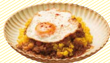
カレーピラフカレー 900 Curry Pilaf Curry