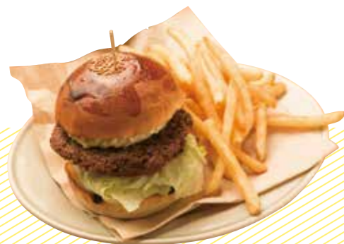
ハンバーガー Hamburger 900