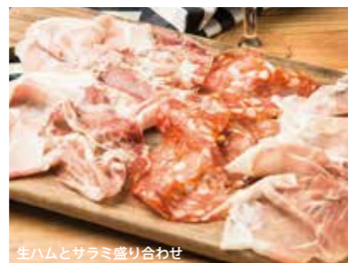
生ハムとサラミ盛り合わせ