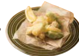
アボカドと マリボーチーズの フリット