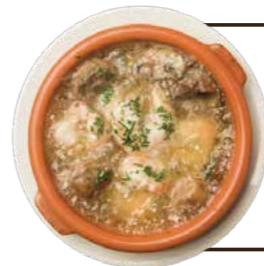
海老とマッシュルームのアヒージョ