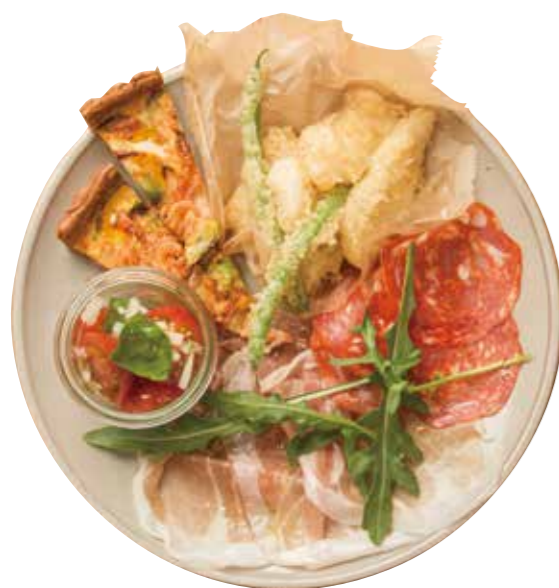
前菜の盛り合わせ (4種盛)

17:00-22:00 I.o.(Mon-Fri)/ -21:00 I.o.(Sat, Sun, Holidays)