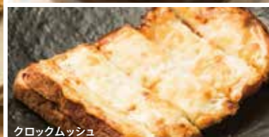
クロックムッシュ